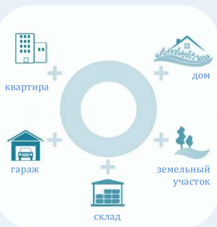
Схема 2. Недвижимое имущество

в) дачный земельный участок - земельный участок, предоставленный гражданину или приобретенный им в целях отдыха (с правом возведения жилого строения без права регистрации проживания в нем или жилого дома с правом регистрации проживания в нем и хозяйственных строений и сооружений, а также с правом выращивания плодовых, ягодных, овощных, бахчевых или иных сельскохозяйственных культур и картофеля).