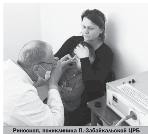
Риноскоп, поликлиника П.-Забайкальской ЦРБ

Более 40 обследований провел уже отоларинголог поликлиники Петровск-Забайкальской ЦРБ с использованием нового риноскопа. Оборудование приобрели в рамках программы «Модернизация первичного звена здравоохранения».