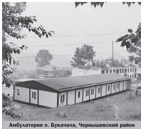
Амбулатория п. Букачача, Чернышевский район

Амбулатория в поселке Букачача Чернышевского района, возведенная благодаря программе «Модернизация первичного звена здравоохранения», прошла необходимые проверки и получила лицензирование на осуществление медицинской деятельности.