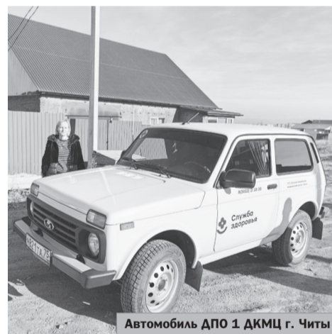
Автомобиль ДПО 1 ДКМЦ г. Читы

Детский клинический медицинский центр г. Читы получил четвертый автомобиль благодаря программе «Модернизация первичного