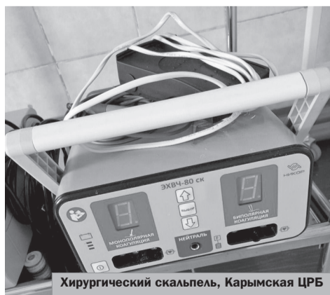
Хирургический скальпель, Карымская ЦРБ

Более 100 операций провели хирурги Карымской ЦРБ с использованием современ-