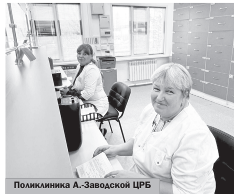
Поликлиника А.-Заводской ЦРБ

Начала действовать после проведения капитального ремонта в рамках реализации